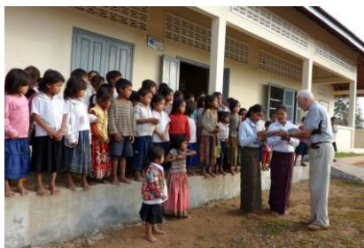
Maternelle de Pyour Chrouk

ACF a participé au financement de travaux dans 2 secteurs