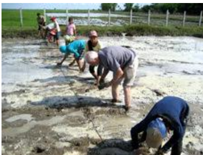
Repiquage du riz