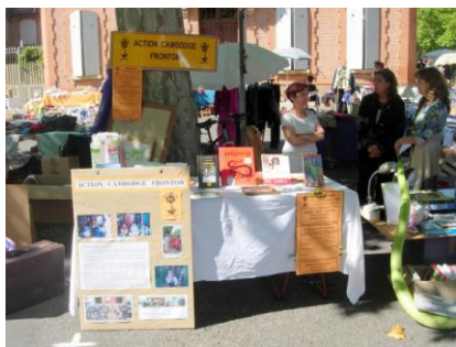
Stand A.C.F au vide-grenier de Fronton