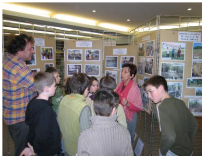
Présentation d' ACF dans les écoles